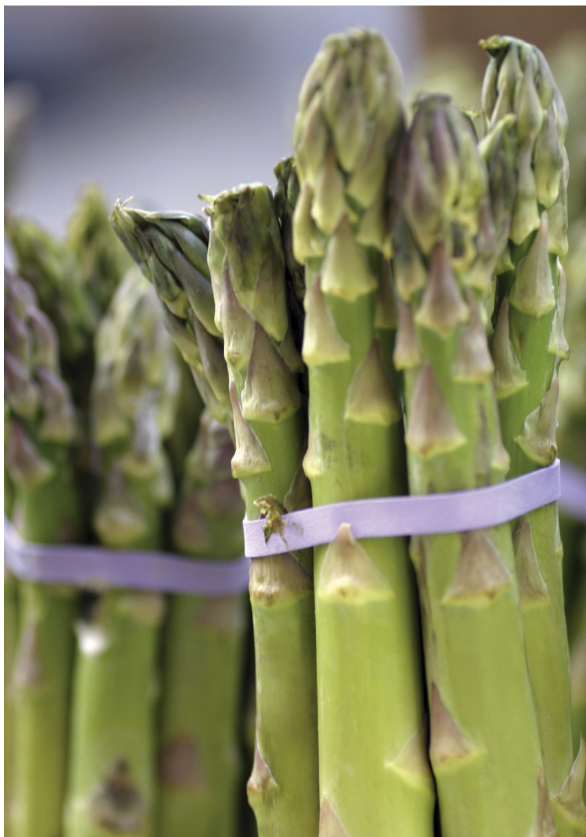
Vida útil del espárrago