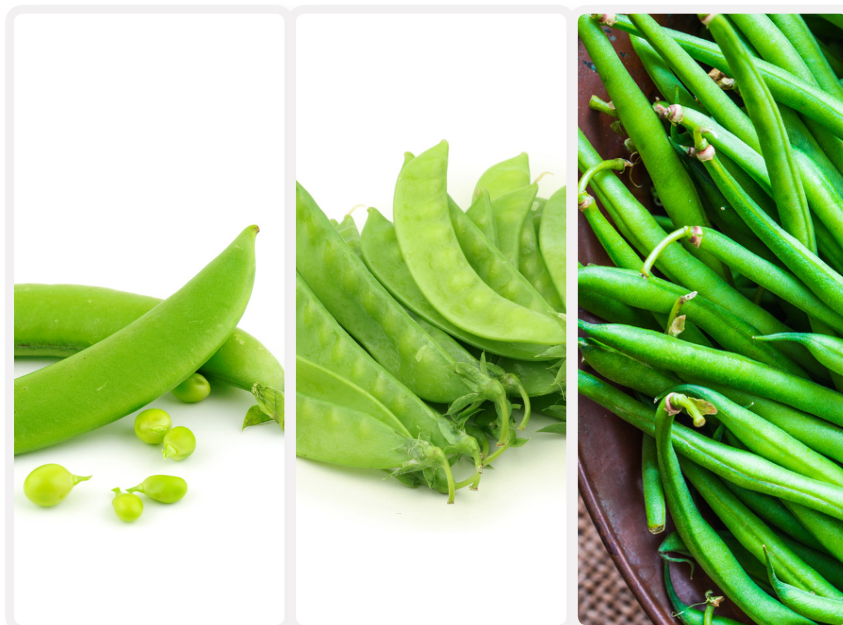
豌豆/四季豆的保质期